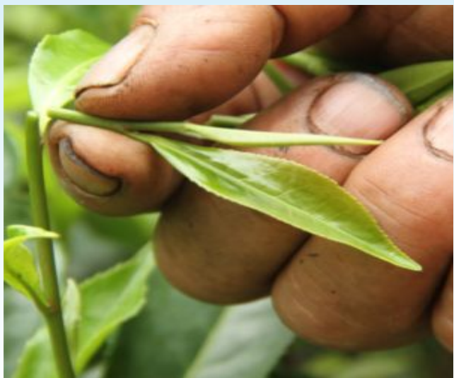
Creador es Horacio Bustos 2