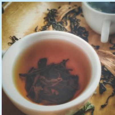
Creador es Horacio Bustos 2