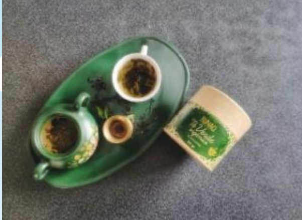
Creador es Horacio Bustos 2