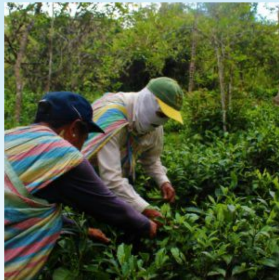
Creador es Horacio Bustos 2