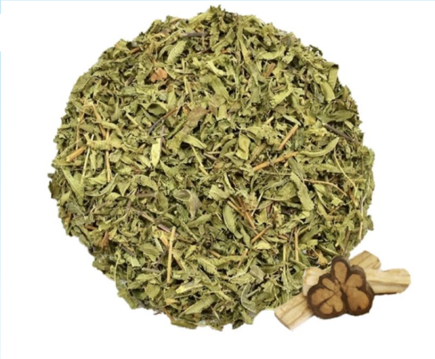
Muña Té en Peru

El té en Perú no es exactamente como tenemos en los estados unidos, es muy popular por medicina por que los ingredientes son también los vegetales, las bayas, y las especias. 3