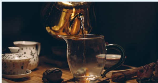
Creador es Tea Culture in Peru 3