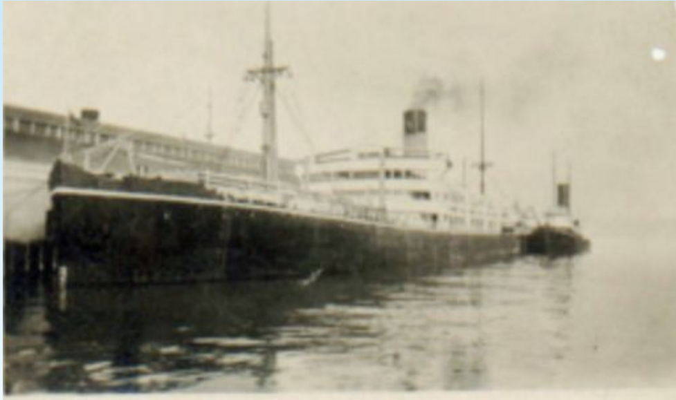
“Anyo Maru” - buque de vapor