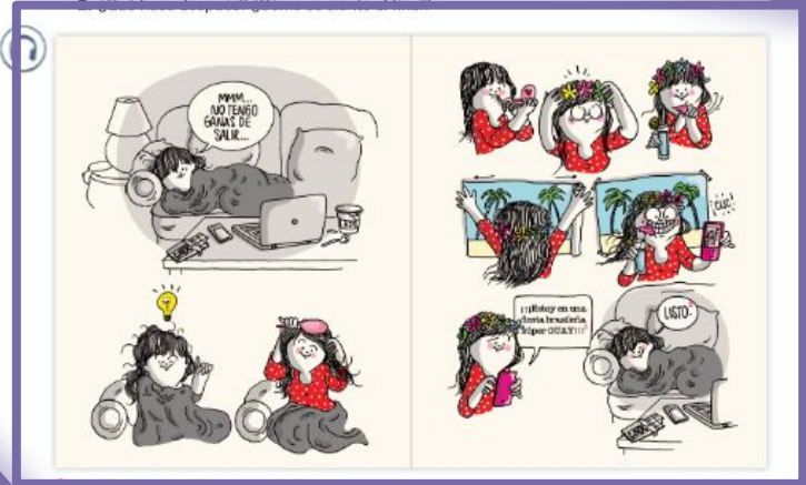
1 guay: cool 2 listo: done!

1. ¿Qué está haciendo Nina al principio? ¿Cómo se siente?