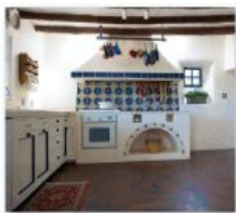
↑ "Cómo decorar tu casa al estilo mexicano". Alberto Echeverría Penalva

B. ¿Te gusta este estilo? Explica por qué.