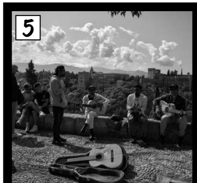
Mirador de San Nicolás