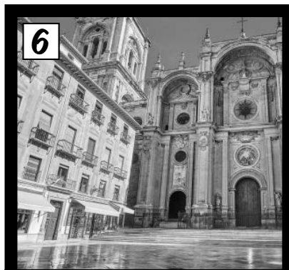
Plaza de las Pasiegas