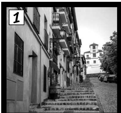
Cuesta de la Victoria

¿Dónde ha pasado? Relaciona los acontecimientos de la novela con los lugares de la ciudad donde ocurren.