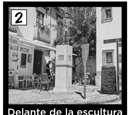
Delante de la escultura del Chorrojumo